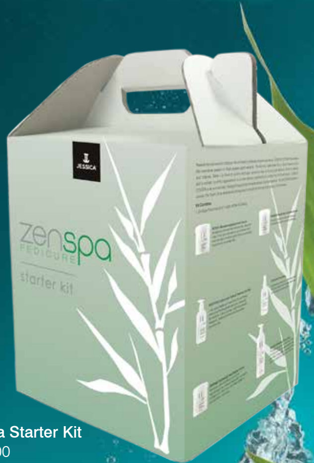
Zenspa Starter Kit ZEN 500

KIT BEVAT 1 STUK VAN DE VOLGENDE 16 oz REVIVE Microdermabrasion Foot Scrub 8.5 oz RESTORE Cuticle & Callous Remover 15 oz INTENSE Hydrating Heel Repair Crème 16 oz AWAKEN Foot Soak Crystals 8 oz REFRESH Foot Spray 16.5 oz HEAVEN Silkening Foot Lotion 1 ZENSPA Brochure